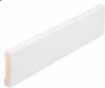
FOT OG KARM

Skrå og glatt taklist, glatt gulvlist og karmlist (12x58) leveres farbrikk malt hvit. Festes med synlige spikerhull. Foringer for vinduer og dører leveres i fabrikk malt hvit furu.